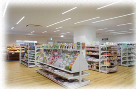
～コンビニ機能も充実～