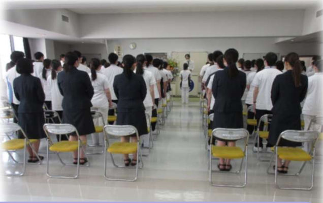
入職式の写真です 今年度は80名の新入職員が入職しました 多職種でたくさんの同期ができます