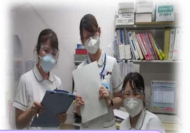
医師・看護師など他職種との距離も近いです