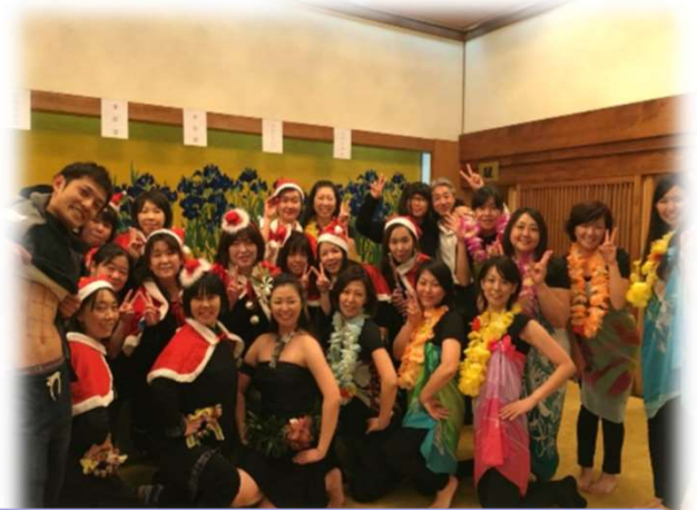
職員が牛久かつぱ祭りと忘年会に参加したときの写真です※参加は任意です

医療法人社団 常仁会 牛久愛和総合病院 〒300-1296 茨城県牛久市猪子町896番地