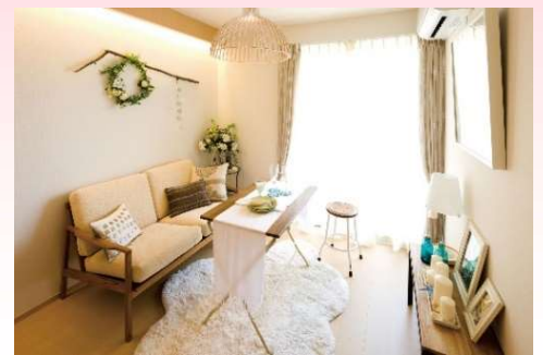
リビング・ダイニング