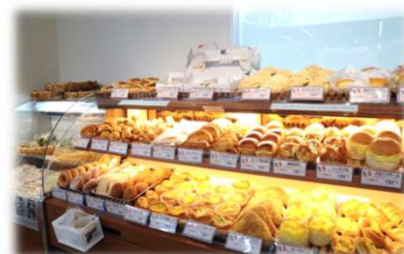
～焼きたてパンも販売中～