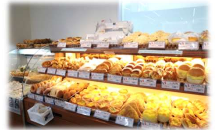
～焼きたてパンも販売中～