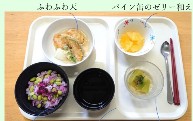
梅枝豆ごはん お吸い物 翡翠なす