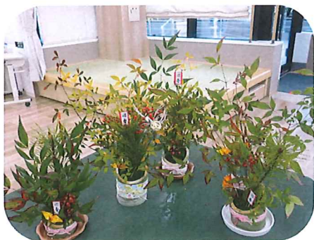
入所さんの 手作りミニ門松