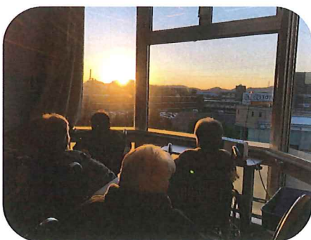
2026.1.1元旦 初日の出 🌅 「良い年になりますように」