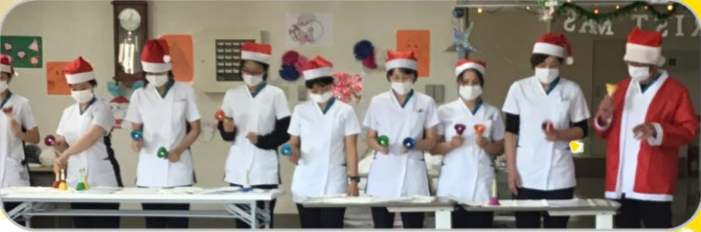
ハンドベルの演奏