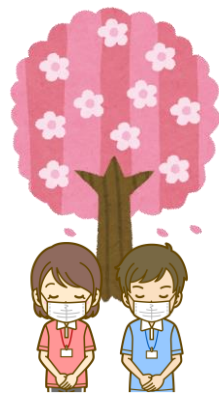
介護医療院 職員一同

職員は、「手洗い・マスク・密を避ける」を守り、体調不良時は受診するを徹底しています。