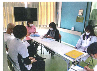
カンファレンスの様子