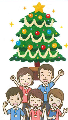
介護医療院 職員一同

ご家族様も多忙な時期と思いますので、お体に気をつけて、元気に年末年始をおむかえください。