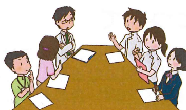
担当者会議(カンファレンス)に参加